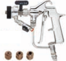
Kit L91X Turbo

Пистолет Airless Макс. Рабочее давление 500 Бар