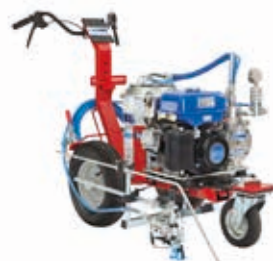
Оборудование для нанесения дорожной разметки Airless