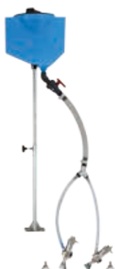
Комплект для распределения светоотражающих шариков для двух автоматических пистолетов