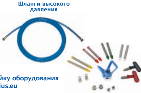
Шланги высокого давления

См. полную линейку оборудования на сайте www.larius.eu