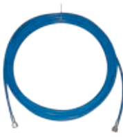
Шланги высокого давления