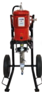
Моечное промышленное оборудование с пневмоприводом