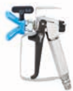
Пистолет Airless AT250 Макс. рабочее давление 250 Бар