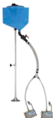
Комплект для распределения светоотражающих шариков для двух ручных пистолетов