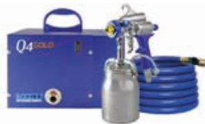
Агрегат Q4 Gold Professional HVLP турбинный