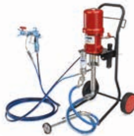
Агрегаты смешанного распыления Mist-less