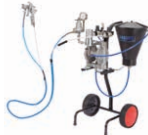
Агрегаты низкого давления