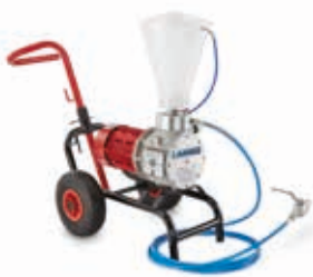
Помпы для инъекции смол