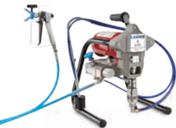
Агрегаты поршневого типа с электроприводом