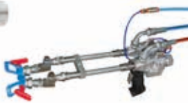
Пистолет LA95 2K Внешнее смешивание