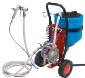
Аппараты для густых жидкостей и заполнителей с зернистостью