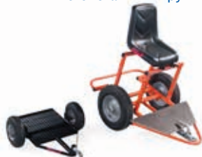
Подставка для оператора