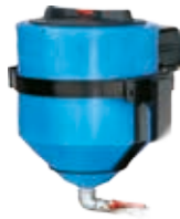
Бак с антипригарным покрытием lt.50