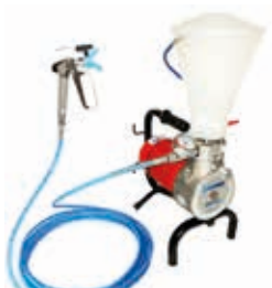
Агрегаты мембранные с электроприводом